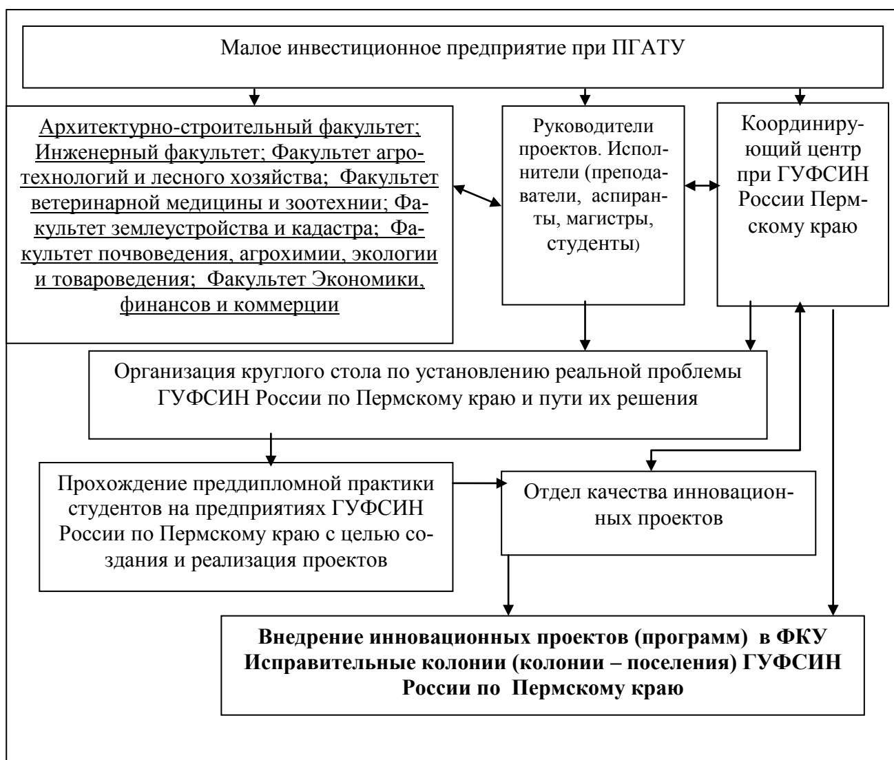
Рисунок 4 - Организационная структура деятельности информационно-консультационного центра малого инвестиционного предприятия.

экономического пространства получать прибыль от взаимовыгодного сотрудничества. Например, на базе ПГАТУ возможна организация структуры (МИП), которая позволит разрабатывать для специальных учреждений ФСИН Пермского края современные проекты с привлечением специалистов факультетов ПГАТУ, чья профессиональная подготовка необходима для разработки проекта (рисунок 4).