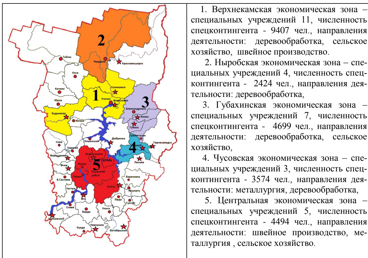
Рисунок 2 - Расположение экономических зон ФСИН Пермского края.

Наиболее значимым показателем, характеризующим социально-экономический аспект в рамках хозяйственной деятельности учреждений ФСИН и определяющим степень необходимости повышения экономической эффективности подсобных хозяйств в специальных учреждениях ФСИН, является создание экономических зон, что создает условия привлекательности и доступности для вложения средств бизнес-структурами в хозяйственную деятельность специальных учреждений ФСИН (рисунок 2).