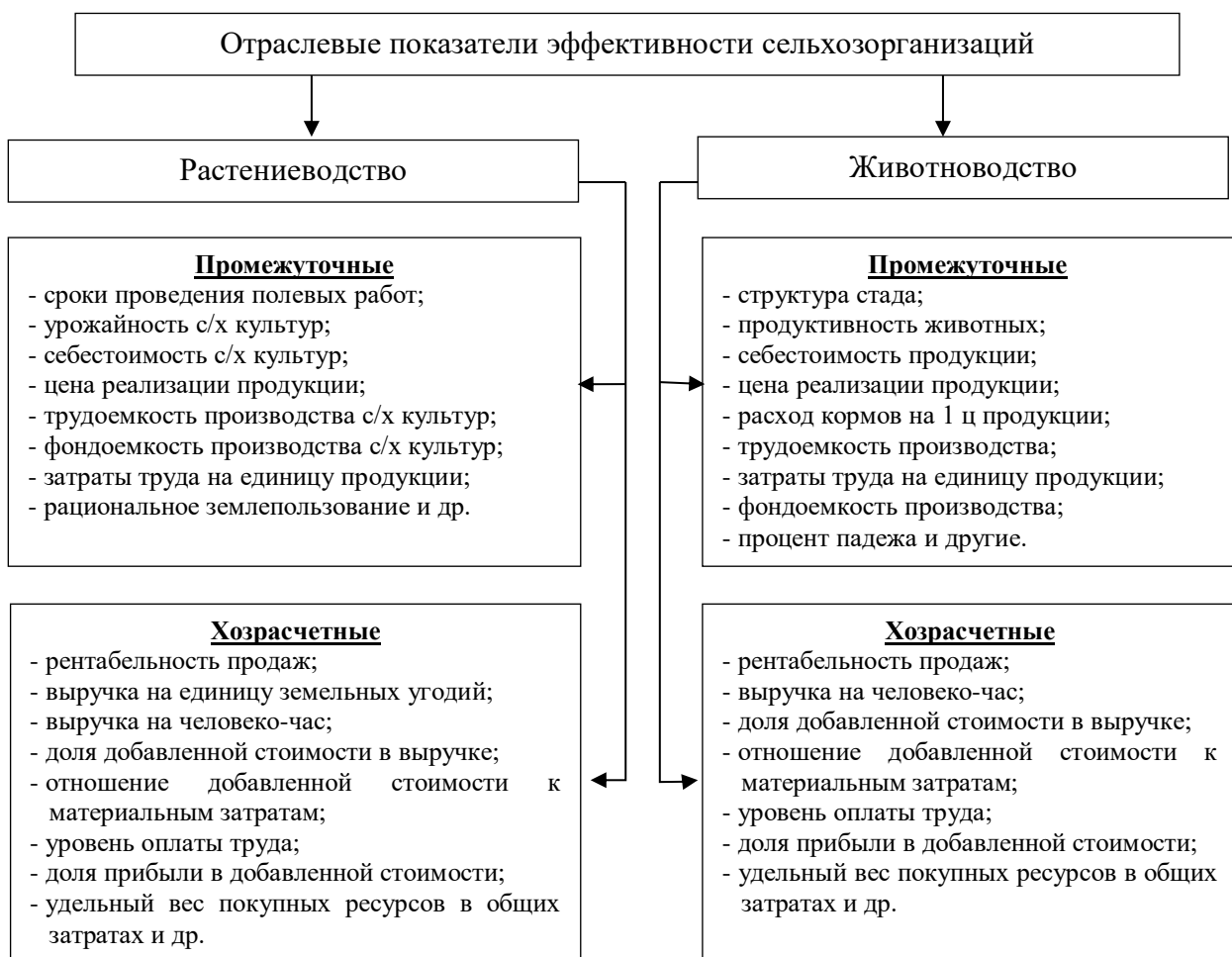
Рисунок 1 – Показатели эффективности растениеводства и животноводства*. *Составлено автором по результатам исследования

характеристик, на три основные группы: институты – факторы (собственность, государство, фирмы, институты рынка, крестьянский двор и прочие); институты – условия (традиции крестьянства, стереотипы экономического поведения и т.п.) и институты – механизмы (реформы, правовые аспекты, программы, планы, инструкции, контракты и т.д.).