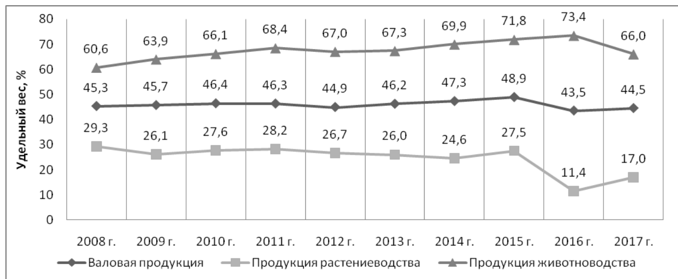
Рисунок 3 – Удельный вес сельхозорганизаций Калужской области в областных итогах производства продукции, %*.

Удельный вес сельскохозяйственных организаций в соответствующих итоговых показателях области представлен на рисунке 3.