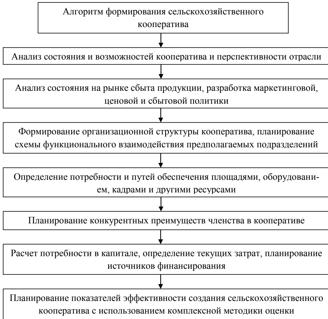
Рисунок 5 – Алгоритм формирования сельскохозяйственного кооператива (разработано автором)

Диссертационное исследование позволило разработать алгоритм формирования сельскохозяйственного кооператива, который может быть использован в процессе создания любого кооперативного формирования в сфере АПК (рисунок 5).