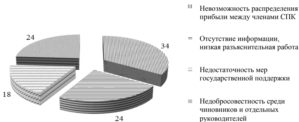
Рисунок 3 – Результаты анкетирования по вопросу «Какие проблемы, на ваш взгляд, тормозят развитие сельскохозяйственной кооперации?» (составлено автором)

Автором было проведено исследование, направленное на определение степени потребностей субъектов малых форм хозяйствования в создании сельскохозяйственных кооперативов, а также их отношения к сельскохозяйственной кооперации в целом (рисунок 3).