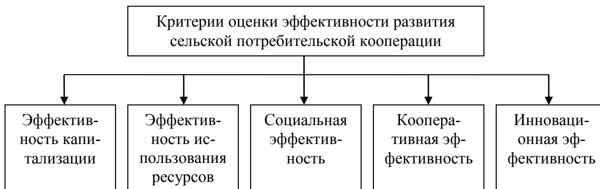
Рисунок 2 – Критерии оценки эффективности развития сельской потребительской кооперации (составлено автором)

показатели. Данная методика разработана с учетом предложенной автором системы критериев оценки эффективности кооперации, что позволяет комплексно оценивать эффективность развития сельской потребительской кооперации, а также экономически обосновывать управленческие решения в сельскохозяйственном кооперативе (рисунок 2, таблица 2).