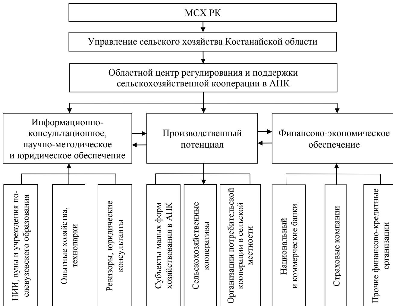
Рисунок 4 – Схема организации Областного центра регулирования и поддержки сельскохозяйственной кооперации в АПК (разработано автором)

ствия государственных органов власти и кооперативных организаций (рисунок 4).