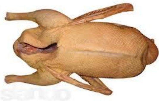
Рисунок 15 – Образец тушки 1

4. Тушки каких сельскохозяйственных птиц представлены на рисунках 17-20?