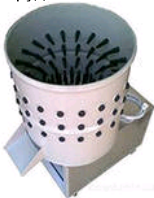
Рисунок 23 – Образец оборудования

6. Какое оборудование и машины изображены на рисунках 23,24?