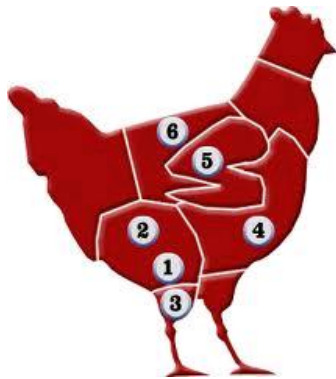
Рисунок 10 – Образец тушки 1