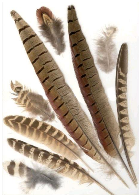
Рисунок 14 – Образец пуха и пера

4. Тушки каких сельскохозяйственных птиц представлены на рисунках 17-20?