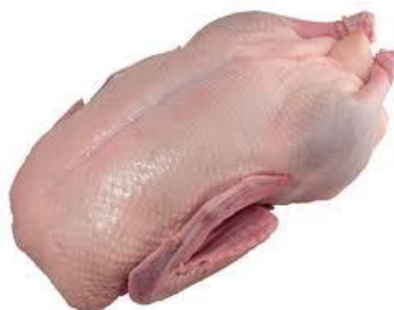
Рисунок 18 – Образец тушки 4