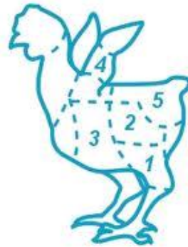
Рисунок 11 – Образец тушки 2