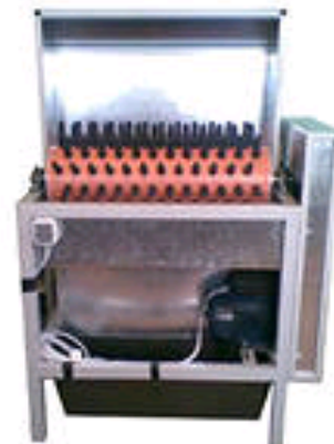
Рисунок 24 – Образец машины

7. Определить «возраст» яиц по удельному весу.