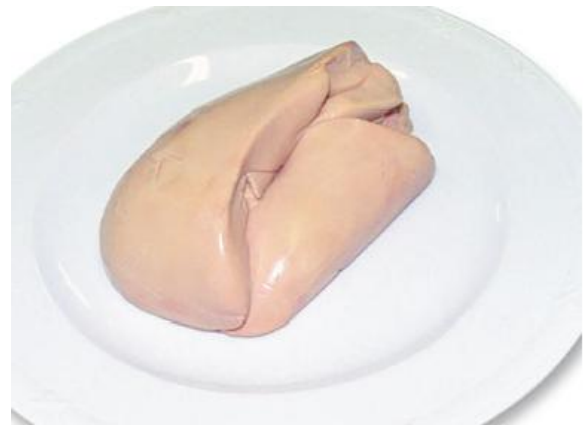
Рисунок 22 – Образец части тушки

6. Какое оборудование и машины изображены на рисунках 23,24?