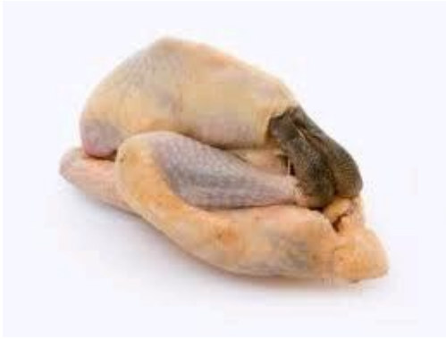
Рисунок 19 – Образец тушки 4