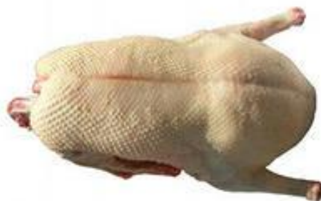
Рисунок 16 – Образец тушки 2