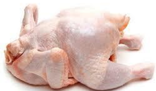
Рисунок 17 – Образец тушки 3