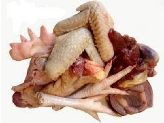
Рисунок 21 – Образец частей тушки